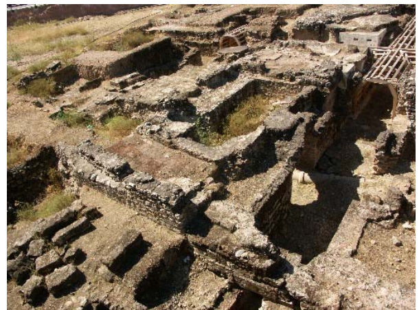
Abb. 5 Sic transit gloria - so vergeht der Ruhm Palast des Marcus Aurelius Valerius Maximianus, erbaut gegen Ende des 3. Jahrhunderts n. Chr.

Den palastartigen Denkbunkern in unseren Köpfen stehen die Zelte der Nomaden gegenüber. Das Leben der Nomaden ist voller Risiken und Gefahren. Nomaden sind weder versichert noch sicher - aber sie sind freie Menschen. Die Dynamik ihres Lebens treibt sie jeden Tag in neue Gefilde. Sie brechen jeden Morgen ihre Zelte ab und bauen sie am Abend an einem anderen Ort wieder auf. Einmal abgesehen von ihren teils starren kulturellen Prägungen muss ihr Denken dynamisch und ständig auf Neues ausgerichtet sein. Die Fähigkeit offenen Denkens ist in unseren Denkpalästen verloren gegangen.