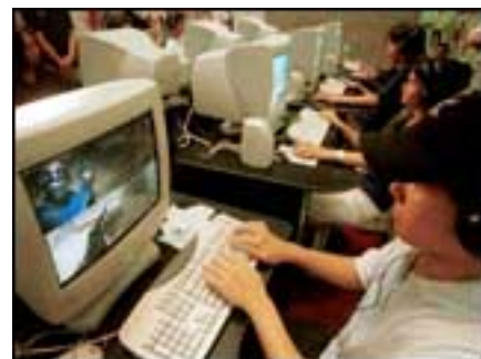
Abb. 3 Die Geldwerdung Gottes am PC Quelle: RTE Business

http://www.rte.ie/business/2002/0719/ebay.html