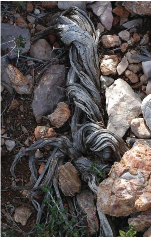
Abb. 1 Vertrocknet. Was droht uns Wissenden?