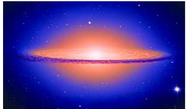
Abb.7 Vom Dunkel des Unbewussten zum Licht des Bewusstwerdens: Aus Es muss Ich werden (Freud)