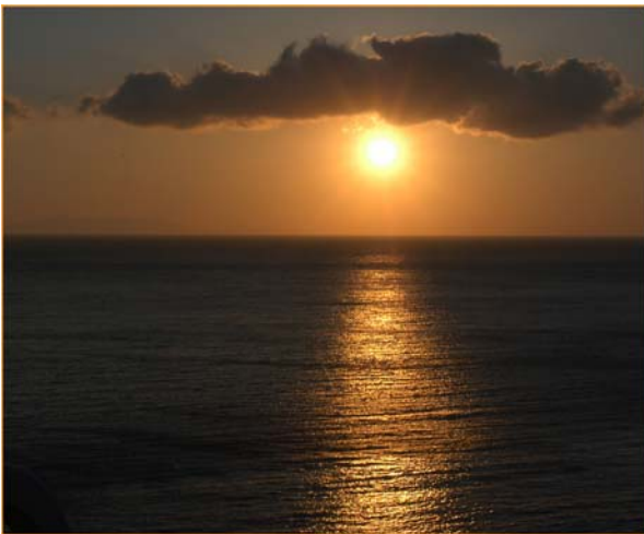
Abb. 10 Sonnenuntergang auf Tilos, Ägäis

Wir erleben die Götterdämmerung eines überalterten Materialismus. Immer deutlicher spüren wir, dass wir nicht vom Brot allein leben. In den großen Wellen der Geschichte haben sich materielle und ideelle Kulturen abgelöst. Dem Materialismus der Antike folgte die Inbrunst des Mittelalters. Die Antike versank in der Sinnlosigkeit des Daseins, das Mittelalter verstieg sich in die Verachtung des Lebens auf Erden und in die Glorifizierung der Transzendenz. Mit der Aufklärung begann die neue materialistische Sicht der Dinge. Und wir versinken erneut, wie damals die Epigonen des alten Roms.