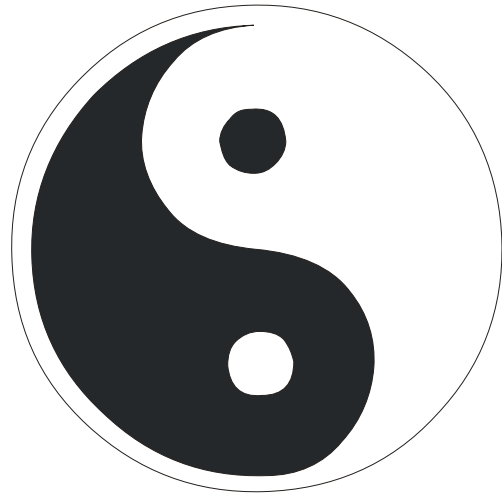
Abb. 13 Yin und Yang Biophilie ist der liebende Kampf des Menschen zwischen Spaltung und Einheit. Dadurch reifen wir vom Menschsein zum Menschwerden

Im Stein schläft es, in der Pflanze träumt es, im Tier beginnt es aufzuwachen und im Menschen wird es zum Leben erweckt. Ein alter Zen-Meisters über das Bewusstsein