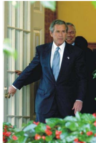
Abb. 6 Die USA im Wandel der Zeit: Vom Retter Europas zur eigennützigen Hegemonialmacht