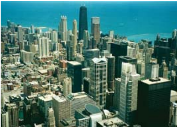
Abb. 8 Wolkenkratzer statt Dome

Unser Gehirn wurde ohne Gebrauchsanweisung abgegeben. Wir taumeln von der Freiheit zur Hörigkeit, manchmal Halt findend an Ideen, die eine Zeit beherrschen. Dann sind wir „in“. Wer „in“ ist, kann nicht mehr frei sein. Er rennt ohne Ziel. Wenn alle rennen, ist es klug, sich auf einer Bank auszuruhen.