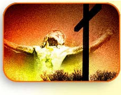
Abb. 9 Jesus, Wegbereiter der Biophilie

Und so blieb ich bis heute ein Unheiliger voller Makel, aber immerhin ein suchender Mensch. Und im Alter meine ich zu ahnen, dass mich der bärtige Riese von damals trotzdem liebt. Er hat seine Furcht erregende Miene verloren, er ist jetzt so sanft, dass ich mich in seinem Schoße geborgen fühle. Er ist weder Mann noch Frau. Ich nenne ihn Ursprung oder Sein. Manchmal, scheint es, liebt dieses sanfte Wesen auch meine Unheiligkeit und versteht meine Ängste. Und dann schäme ich mich meiner stillen Tränen nicht. Und so träume und beichte ich in diesem sanften Schoß im Vertrauen auf den umfassenden Sinn und das unendliche Sein. Und dann sagt es zu mir: „Ich habe die Hölle hier ansiedeln müssen, damit ihr lernt, euch zu entwickeln. Erst wenn ihr lernt, alles Leben zu lieben, wird sich die Hölle in Freude verwandeln.“