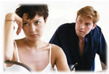
Abb. 4 Marketing - eine wissenschaftliche Form der Manipulation

dieren. Eine Fata Morgana wird dir erscheinen. Niemand berichtet so, wie du es erlebt hast. Der Journalist schreibt für seine Auflage und für seine Aktionäre. Die Wahrheit hat das Nachsehen. Jeden Tag erfahren wir mehrfach, dass etwas war. Wie es war, bleibt uns verschlossen. Und damit verzerren wir unsere Erkenntnis, unsere Sicht von Welt. Ohne es zu merken, werden wir von den Medien manipuliert. - Die zweite Übung heißt Medienfasten. Wenn wir uns im Urlaub zwei Wochen totales Medienfasten auferlegen, sind wir bei der Wiederaufnahme der Arbeit keineswegs unterinformiert. Wir empfinden es als Glück, vom Unwichtigen verschont geblieben zu sein. Nahtlos lesen wir die Zeitungen weiter, ohne die befürchtete Informationslücke. Das Wichtigste haben wir mündlich, im Gespräch mit Menschen, erfahren.