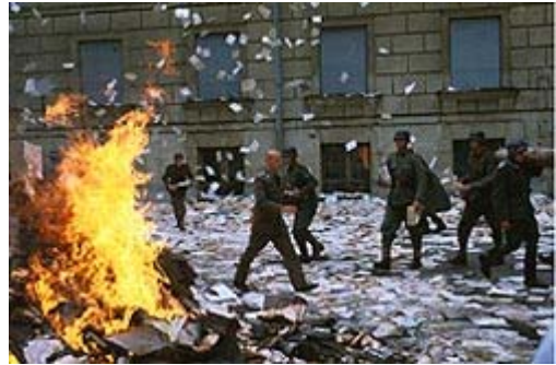
Abb. 12 Verbrennung der Leichen Adolf und Eva Hitlers aus dem Film „Der Untergang“